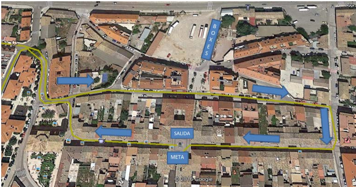
Meta situada en la plaza España

Al finalizar la vuelta continuarán hasta el final de la calle La Jota, para girar por la Avenida Goya y finalmente por la calle Valenzuela Soler para afrontar la recta final a meta, la cual estará situada en la Plaza España, al igual que la salida, donde se dará por finalizada la competición.