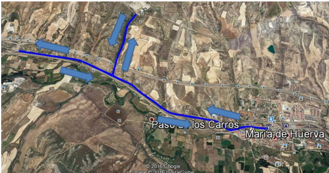
Circuito de bici (2 vueltas), por carretera N-330 dirección Muel