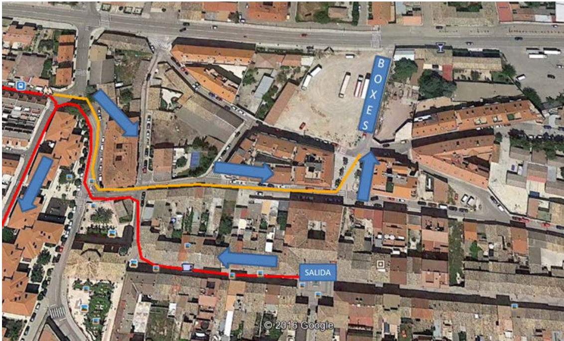
Detalle del enlace a la T1.

Segmento bici: El segmento ciclista se realiza con bicicleta de carretera que cumpla las especificaciones del Reglamento de Competiciones FETRI (artículos 5.2). El recorrido constará de 2 vueltas a un circuito de 10,5 km completando de esta manera un total de 21 km, en el cual no estará permitido el drafting entre diferentes equipos.