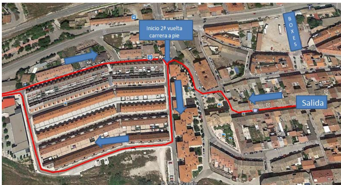
Detalle de la salida y punto de inicio de segunda vuelta.

Área de transición de carrera a pie a ciclismo (T1): Los duatletas deberán abandonar el circuito de carrera a pie (tras la segunda vuelta) para dirigirse a la T1 por la calle de la Jota, girando a la izquierda por la plaza Luis Buñuel y así dirigirse a la calle Agustina de Aragón, donde estará ubicada la transición, en el enlace que sale en la imagen siguiente de color naranja.