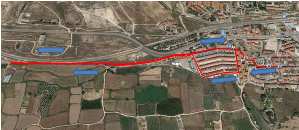
Recorrido primer segmento carrera a pie 5km (2 vueltas).