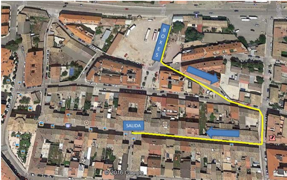
Detalle del enlace de la T2 al segundo segmento de carrera a pie.

Tras el paso a la altura de la salida se realizará una vuelta similar a las que se realizan en el primer sector de carrera a pie, con la diferencia de que el punto de giro de 180º se realizará 400m antes esta vez (ambos giros estarán bien indicados y con personal de la organización)