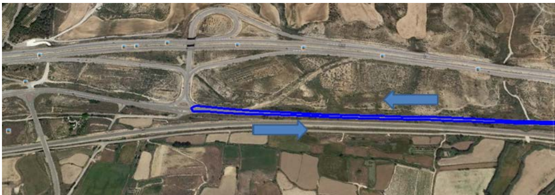
Punto de giro (poco antes del desvío a la A-23)

Área de transición de ciclismo a carrera a pie (T2): La segunda área de transición está ubicada, al igual que la primera, en la Calle Agustina de Aragón. Una vez completada la segunda vuelta del recorrido de ciclismo, deberán girar a la derecha por la calle las Escuelas para así entrar a la T2 en la misma dirección de entrada que lo han hecho en la T1, debiendo realizar, tras dejar el material de ciclismo, el pasillo de compensación por la misma calle.